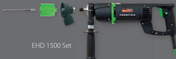
EHD 1500 Set