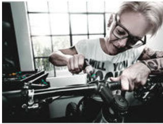
Voreingestellte, einstellbare Drehmomentschraubendreher