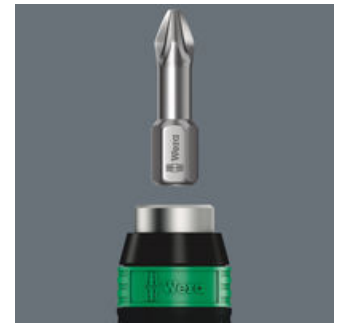
Variabel durch blitzschnellen Bit- oder Nuss-Wechsel dank Rapidaptor-Technologie.