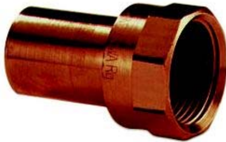
XPCUG 280 G, Absatzmuffe IG