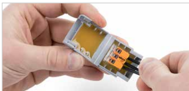
Verdrahtete Klemme in die Gelbox einlegen.