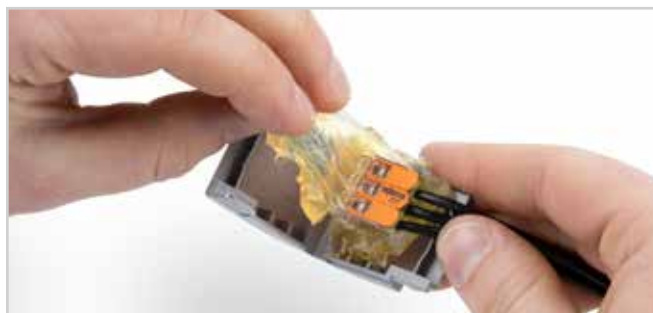
Stromkreise einfach erweitern: Gelbox öffnen, Gel von Klemme entfernen, Klemme öffnen und Leitung mit neuen Komponenten bestücken.