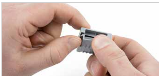
Gelbox an den seitlichen Verrastungen öffnen.