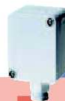
Fühler für Außenmontage Sensor for outdoor mounting