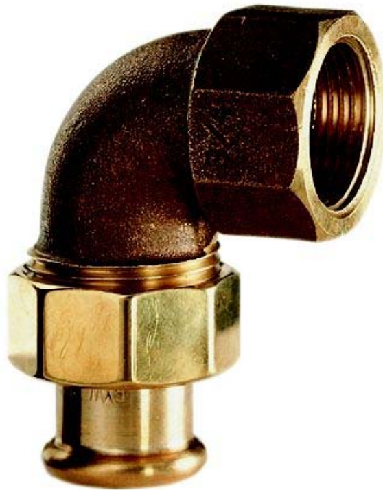
XPCU 096 G, Winkelverschraubung 90° I/IG