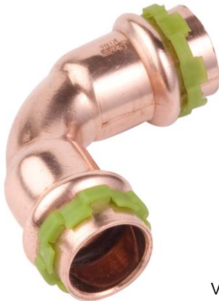
VC 002 A, Bogen 90°, I/I