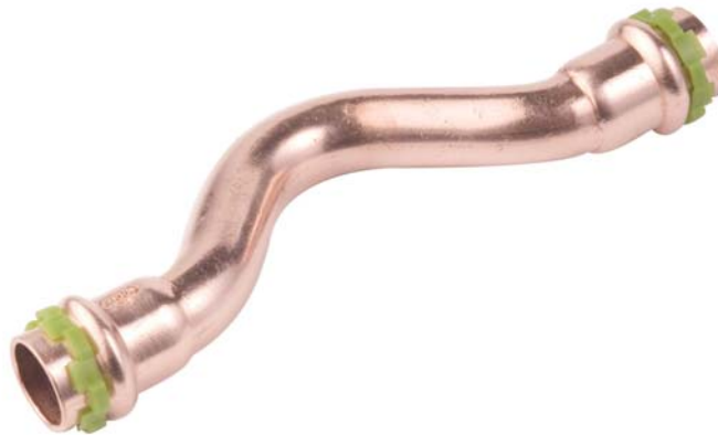
VC 085, Überspringbogen I/I