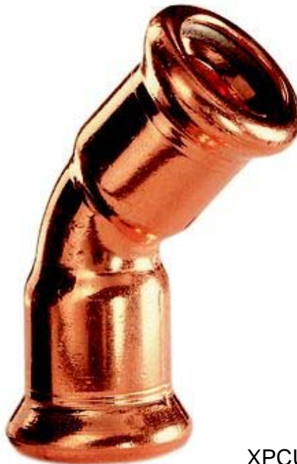
XPCU 041, Bogen 45° I/I